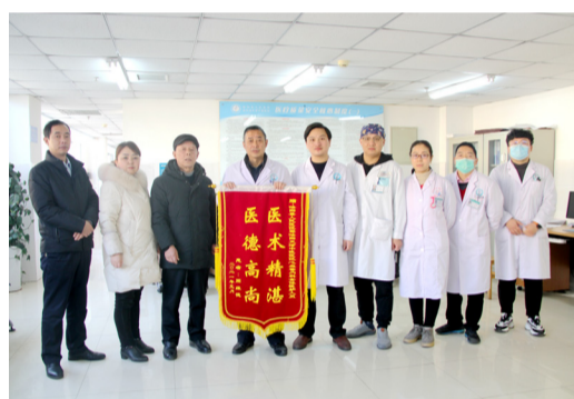
患者送给内二科的锦旗