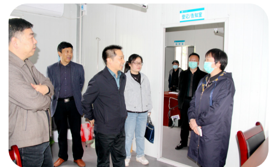
4月13日，市卫健委领导来院督导新冠疫苗接种点保障工作。