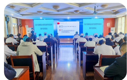
4月13日，医院召开了《医疗保障基金使用监督管理条例》集中宣传活动。