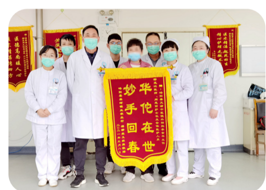
患者送给外四科的锦旗