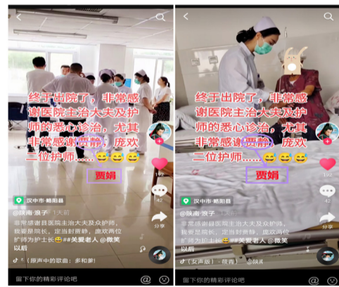
内二科患者发布的感谢视频截图