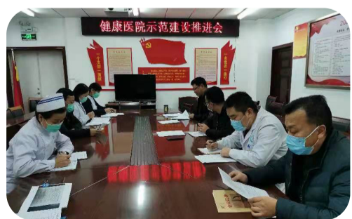
11月26日，医院召开了健康医院示范建设推进会。