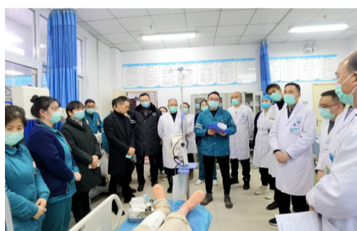
为进一步推进我院创伤中心建设工作，优化严重创伤救治流程，提升多学科团队协作的有效衔接和密切协作，提高对严重创伤的救治成功率，11月24日下午，医院组织开展了严重创伤急救演练。

救护车和急诊科医护作为院前急救立即奔赴现场，评估患者伤情初步诊断后给予紧急救治，呼叫预警的急诊科医生，急诊医生预警通知创伤中心相关人员及相关检查科室接应。患者进入医院，创伤中心立即启动“创伤救治绿色通道”，大家分工明确、井然有序地在急诊科抢救室对患者进行检查、处置、会诊。确定诊疗方案后，当即行（右侧气胸）胸腔闭式引流术，行颈部深静脉置管术，将患者转入手术室急诊手术，患者术后将进入创伤ICU接受进一步高级生命支持。