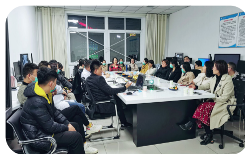
11月10日，医学影像科和妇产科MDT联谊会—探讨介入治疗在重度产后出血的临床应用。