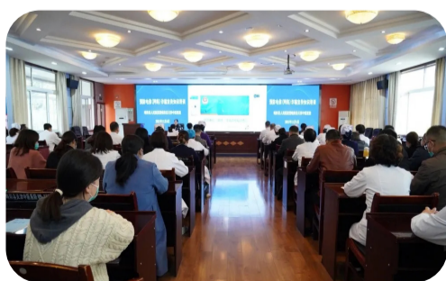
11月4日，县公安局反诈中心民警主讲了《预防电信（网络）诈骗宣传知识培训》。