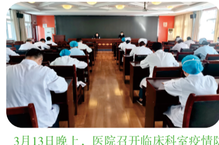
3月13日晚上，医院召开临床科室疫情防控防护级别升级会。