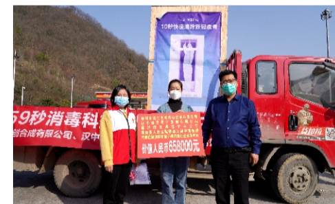
3月10日，深圳市钰创合成光电技术有限公司

司、汉中鼎奕设计装饰有限公司通过略阳县红十字会定向捐赠给我院用于新冠肺炎疫情防控工作物资一批，有紫外线消毒机（防护服病毒清除仓）1台、医用隔离面罩（病毒清除仓专用紫外线防护面罩）400个，价值65万余元。