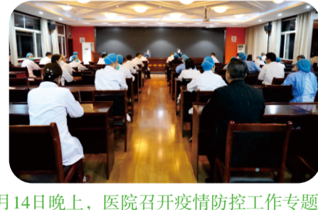
3月14日晚上，医院召开疫情防控工作专题会。