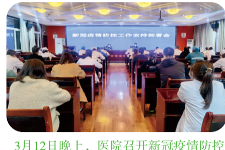
3月12日晚上，医院召开新冠疫情防控工作安排部署会，会上，传达了县纪委《关于再次严明工作纪律的紧急通知》精神，对近期疫情防控工作进行了再安排再部署。