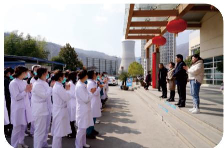
3月7日下午，医院开展了主题为“尊女性 增团结 促和谐”的庆“三·八”活动。