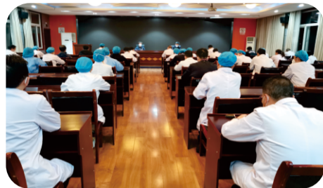
3月15日晚上，医院召开设置黄码病区（隔离病区）安排部署会。