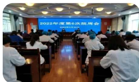
3月30日，医院召开了第6次院周会，重点对复工复产和近期疫情防控工作进行了安排和强调。