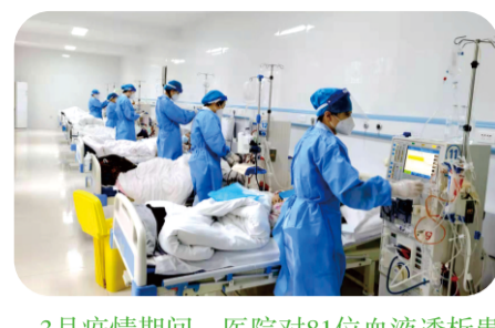
3月疫情期间，医院对81位血液透析患者实施住院闭环管理进行透析治疗。