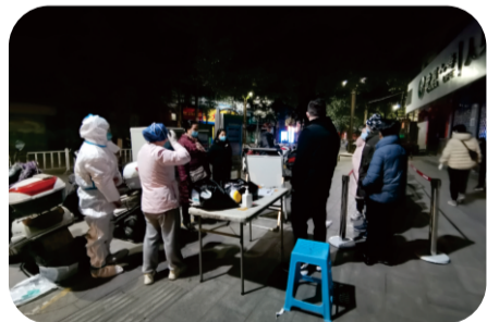
3月8日凌晨，我院核酸采样队奔赴各社区紧急开展核酸采样工作。