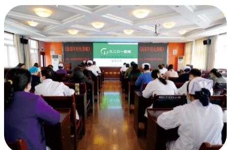
3月3日，医院邀请三二〇一医院医学美容专家来院开展专题讲座活动。