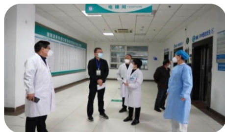
3月29日，市卫健委专家组一行来院督查疫情防控工作。