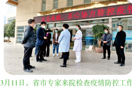
3月11日，省市专家来院检查疫情防控工作。