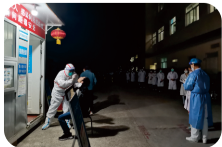
3月8日凌晨，医院紧急开展全院全员核酸检测。