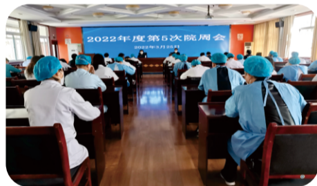
3月25日，医院召开2022年度第5次院周会。传达学习市卫健委“全市卫健系统全民反诈”视频会议会议精神和要求，并对近期疫情防控工作进行了再强调再安排。