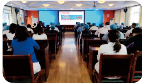
3月21日，医院开展新冠病毒抗原检测视频培训，当日在院内开展抗原检测工作。